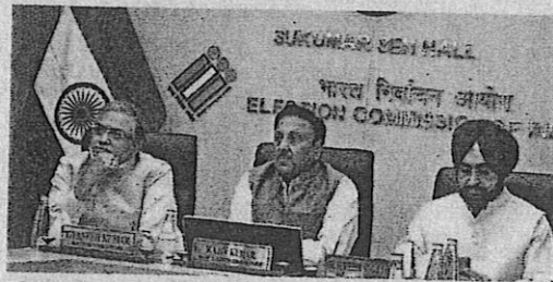
Election commissioners at a press meet (file)

The term of the existing legislative assem-