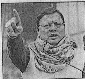
Congress' opposition of UCC was motivated by vote-bank politics, Uttarakhand CM Dhami said

"UCC for Uttarakhand has been a work in progress since we promised it in our manifesto in 2022. Our commitment is absolute. Our first task was to draft it. It has since received the President's assent. We are in the final stages of training