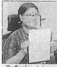
இறுதி வாக்காளர் பட்டியலை தமிழக தலைமை தேர்தல் அதிகாரி அர்ச்சனா படநாயக் வெளியிட்டபோது எடுத்த புகைப்படம்.

தமிழகத்திலேயே அதிக வாக்காளர்கள் உள்ள தொகுதியாக செங்கல்பட்டு மாவட்டத்தில் உள்ள சோழிங்கநல்லூர் தொகுதி உள்ளது. அங்கு ஆண் வாக்காளர்கள் 3 லட்சத்து 45 ஆயிரத்து 184, பெண் வாக்காளர்கள் 3 லட்சத்து 45 ஆயிரத்து 645, மூன்றாம் பாலினத்தவர்கள் 129 பேர் என மொத்தம் 6 லட்சத்து 90 ஆயிரத்து 958 வாக்காளர்கள் உள்ளனர். குறைந்த எண்ணிக்கையிலான வாக்காளர்கள் இருக்கும் தொகுதியாக நாகப்பட்டினம் மாவட்டம் சீழுவேலூர் சட்டமன்ற தொகுதி உள்ளது. அங்கு ஆண்கள் 86 ஆயிரத்து 456, பெண்கள் 90 ஆயிரத்து 45, மூன்றாம் பாலினத்தவர்கள் 1 என மொத்தம் 1 லட்சத்து 76 ஆயிரத்து 905 வாக்காளர்கள்