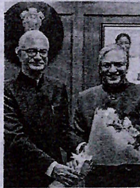
Vivek Joshi, Gyanesh Kumar

Joshi, a former Haryana cadre IAS officer, was appointed as an Election Commissioner on Monday. Born on May 21, 1966, Joshi will turn 65 in May 2031, but as per the law, his term in the poll panel will end on February 18