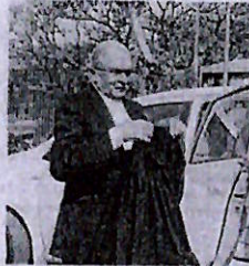
Senior lawyer Prashant Bhushan at the Supreme Court on Wednesday.