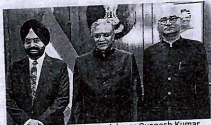
New Chief Election Commissioner Gyanesh Kumar flanked by election commissioners Sukhbir Singh Sandhu (left) and Vivek Joshi while assuming office at Nirvachan Sadan in New Delhi on Wednesday.

On February 17, the government appointed EC Gyanesh Kumar as the next CEC. Mr Kumar is the first CEC to be appointed under the new law, and his term would run till January 26, 2029, days before the EC is expected to announce the schedule of the next Lok Sabha election. Vivek Joshi, a 1989-batch Haryana-cadre IAS offi-