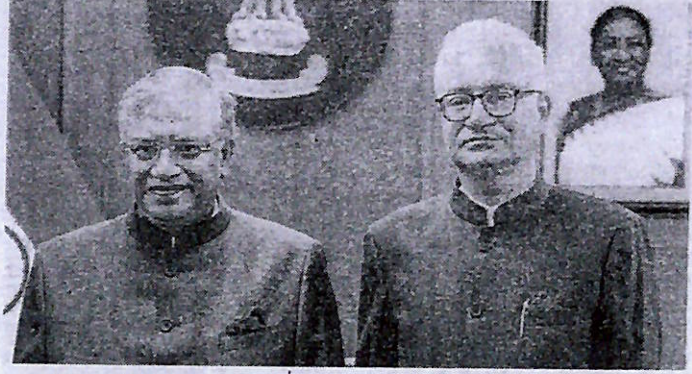
இந்திய தேர்தல் ஆணைய அலுவலகத்தில் புதன்கிழமை பதவியேற்ற தலைமைத் தேர்தல் ஆணையர் ஞானேஷ் குமார் (இடது) மற்றும் தேர்தல் ஆணையர் விவேக் ஜோஷி.

ஞானேஷ் குமார் தலைமைத் தேர்தல் ஆணையராகப் பதவியேற்றதைத் தொடர்ந்து, புதிய தேர்தல் ஆணையராக விவேக் ஜோஷி பதவியேற்றுக் கொண்