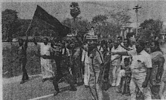
DMK supporters celebrating VC Chandhirakumar's landslide victory in Erode East bypoll on Saturday

In the 2021 Assembly polls, Congress candidate Thirumagan Everaa won by a margin of 8,904 votes against Tamil Maanila Congress (TMC) candidate Yuvaraja, who contested on the AIADMK's Two Leaves symbol. Following his death due to a heart attack, his father and Congress leader EVKS Elangovan won the bypolls in 2023 with a margin of 66,233 votes against AIADMK's KS Thennarasu. The death of EVKS Elangovan necessitated this bypoll.