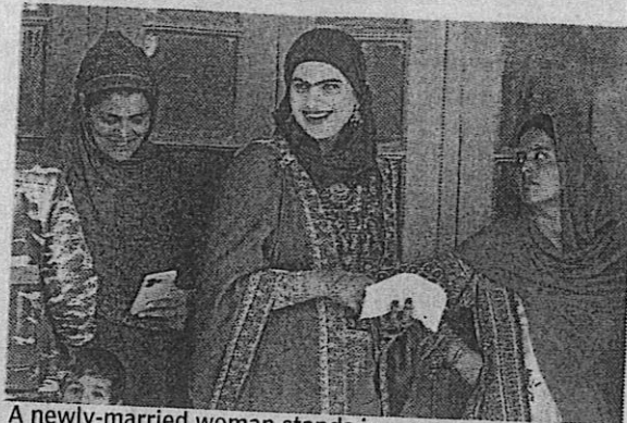
A newly-married woman stands in a queue at a polling station in Budgam district of central Kashmir on Wednesday