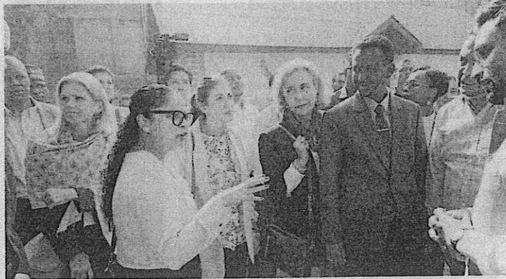
First-hand account: Diplomats from various countries at a polling station during the Assembly election in Srinagar on Wednesday. IMRAN NISSAR

His statement assumes significance because reports of the U.S. Congress after 2019 were critical of the handling of the situation in Kashmir. These reports mainly focused on "restoring democratic processes in J&K". Therefore, the visit is a major diplomatic victory for the Centre to showcase a