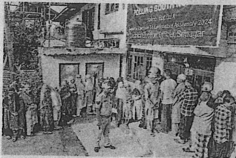
People queue up to cast their votes at a polling booth in Srinagar in the second phase of Assembly election on Wednesday. IMRAN NISSAR

Election Commission data of turnout till 11.50 p.m. show Reasi district