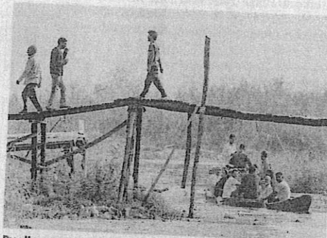
By all means: Voters cross the Dal Lake to go to a polling booth during the Assembly election in Srinagar on Wednesday.

The district's poll percentage was 27.9% in the 2014 election. "Srinagar saw an increase of 5% from the voter turnout of the