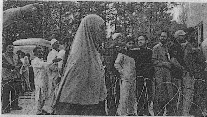
Voters wait outside a polling station in Budgam district

SRINAGAR/JAMMU: An estimated 56 per cent of over 2.5 million electorate in 26 constituencies spread over six districts exercised their right to vote till 5 pm in phase two of Jammu and Kashmir Assembly election on Wednesday amidst tight security, a top official said.