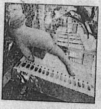
EC explained that the safe deposit and securing of EVMs in the strong rooms being the first priority, the poll turnout data is updated on the app only from 7pm onwards

"It is stated upfront that there is no discrepancy whatsoever in the voter turnout," EC said in its 65-page reply to the AICC's law, human rights & RTI department, while adding that the data provided at 5pm on its voter turnout app is only "interim data of approximate voter turnout (VTR) in the constituency/district/state at that point of time". Stating that polling continues for voters queued