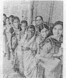
Voters waiting to cast their vote in the Maharashtra Assembly elections. FILE PHOTO

Saying that there was no irregular pattern in voter deletions in the State, the EC said that a rule-based process was followed with