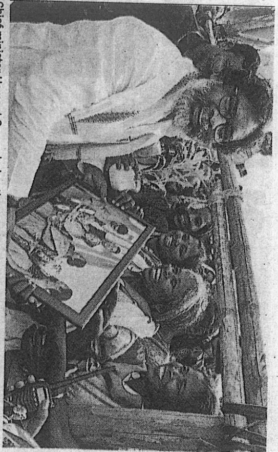
Chief minister Hemant Soren during the "Aapki Yoiana, Aapki Sarkar, Aapke Dawar" programme at Torpa in Jharkhand's Khunti district.