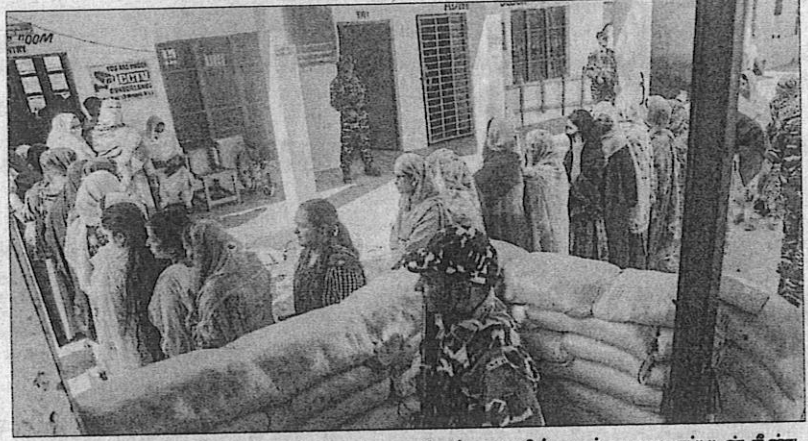
↑ ஐம்மு காஷ்மீரின் கிஷ்துவாரில் உள்ள வாக்குச்சாவுடியில் பலத்த பாதுகாப்புடன் நீண்ட வரிசையில் காத்திருந்து வாக்களித்த பெண்கள்.

காலை 7 மணிக்கு தொடங்கிய வாக்குப் பதிவு மாலை 6 மணி வரை நடைபெற்றது. காலை முதலே மக்கள் ஆர்வத்துடன் வரிசையில் நின்று தங்கள் ஜனநாயக கடமையை நிறைவேற்றினர். மாலை 5 மணி நிலவரப்படி, அதிகபட்சமாக கிஷ்துவாரில் 77.23% வாக்குகள் பதிவாகின. தோடாவில் 69.33%, ராம்பனில் 67.71%, குல்காமில் 59.62%, குறைந்த பட்சமாக புல்வாமாவில் 43.87% வாக்குகள் பதிவாகியிருந்தன.