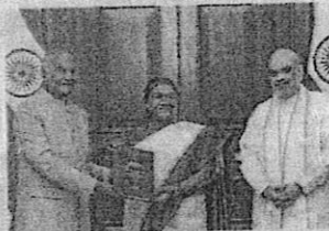
Ram Nath Kovind presents report to President Murmu

NEW DELHI: Moving ahead with its "one nation, one election" plan, the government on Wednesday accepted a high-level panel's recommendations for holding simultaneous polls for the Lok Sabha, state assemblies and local bodies in a phased manner after a countrywide consensus-building exercise.