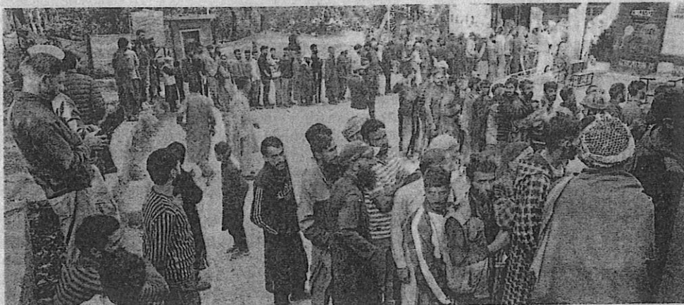
Voters queue up in large numbers during the first phase of assembly election in south Kashmir

Voting began at 7 am and proceeded steadily through the day. Men and women, the young and old, some too frail to walk and others patiently waiting their turn, queued up outside polling booths across Kashmir Valley and Jammu. Of the 90 seats, 24 voted in the first phase - 16 in the Kashmir Valley and eight in the Jammu region. Over 2.3 million voters were eligible to cast the ballot to determine the fate of 219 candidates, including 90 Independents.