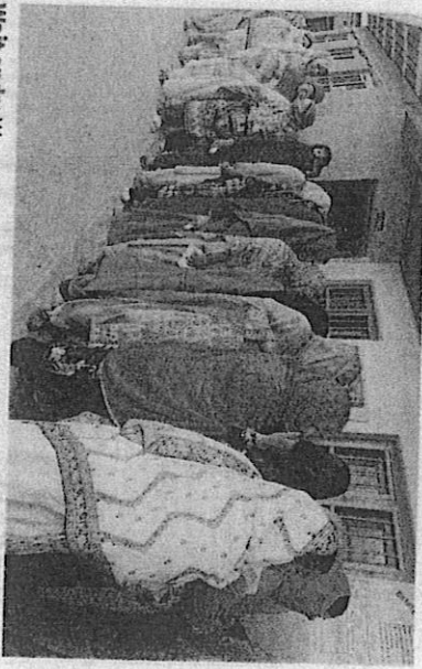
Wait ends: Women queue up at a polling station in Shopian, south of Srinagar, on Wednesday. IMRAN NISSAR

Kishtwar recorded the highest turnout of 80.14% and Pulwama the lowest at 46.65%, as per provisional data at 11.50 p.m. "Peaceful polling was observed in J&K. There are no instances where we have to go for repoll," J&K's Chief Electoral Officer P.K. Pole said.