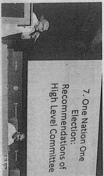
Union Minister Ashwini Vaishnaw addressing a press conference on simultaneous elections, in New Delhi on Wednesday. Minister of State for Information and Broadcasting L. Murugan is at right.

"This is an important step towards making our democracy even more vibrant and participative," Prime Minister Narendra Modi, a strong votary of simultaneous polls, said in a post on X. Calling it a giant stride towards electoral reforms, Home Minister Amit Shah,