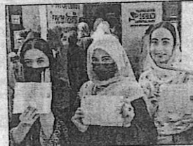
FIRST PHASE: Voters show their slips at a women-only polling station in Kishtwar district on Wednesday

cise ensured that no constituency straddles two districts, allowing for clearer district-wise figures this time, Pole said. Voter turnout varied across districts.