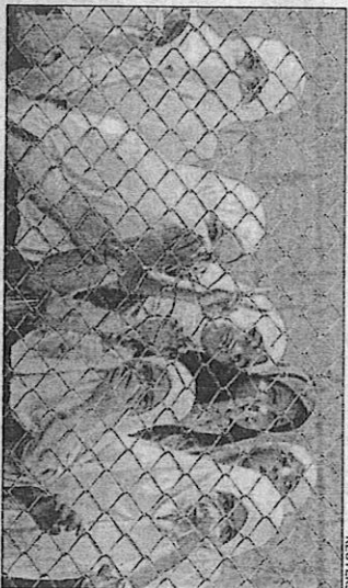
POLL MODE: Schoolgirls listening to Abdul Rashid Sheikh, leader of the Awami Ittehad Party, during a rally in Kupwara district on September 17

son and ex- CM Omar Abdullah is in the fray. The other seat is Budgam. As "Azadi" and autonomy slogans fade, J&K's two major regional parties, Farooq's NC and Mehbooba Mufti's PDP, have focused their campaigns largely on tanning adversaries as covert allies of "BJP" or as those "sponsored by BJP/RSS". In Ganderbal, Farooq accused Awami Ittehad Party (AIP), led by Baramulla MP Sheikh Abdul Rashheed alias Engineer Rashheed, of having adjustments with Independent-backed by the banned Jamaat-e-Islami (JeI). "They are their (BJP's) products. Tell me why he (Rashid) was released