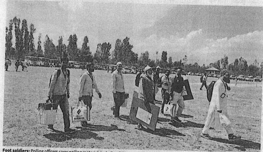
Foot soldiers: Polling officers carry polling material, including EVMs, to a bus that will take them to distant polling stations in Pulwama district of south Kashmir on Tuesday.

Doda and Kishtwar in the Chenab Valley, which witnessed heightened militancy this year and frequent gun battles, are among the districts going to the polls in this phase. Officials said the Army and the J&K Police had stepped up area domination in the upper reaches of the two districts, which have six