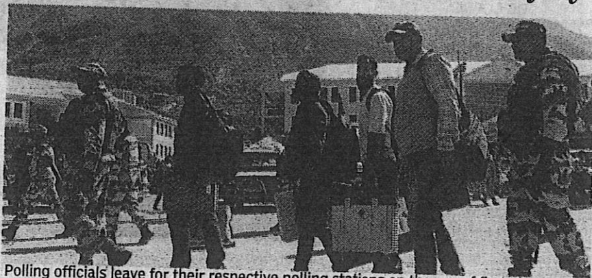
Polling officials leave for their respective polling stations on the eve of first phase of the Jammu and Kashmir Assembly election in Kishtwar on Tuesday.

December last year. The five-judge Constitution Bench of the top court ruled that J&K's special status had been a "temporary provision" and that removing it was constitutionally valid.