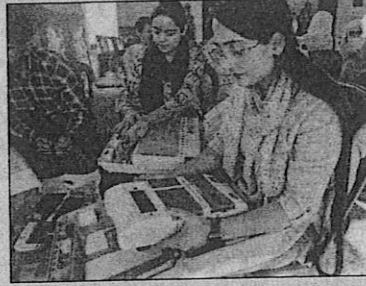
↑ கிஷ்துவாரில் மின்னணு வாக்குப்பதிவு இயந்திரங்களை நேற்று சரிபார்த்த தேர்தல் அலுவலர்கள்.

முதல்கட்ட தேர்தலில், புலம்பெயர்ந்த காஷ்மீர் பண்டிட் சமூகத்தினர் 35,500 பேர் வாக்களிக்க தகுதி பெற்றுள்ளனர். இவர்கள் 16 தொகுதிகளில் வாக்களிக்கின்றனர். இவர்களுக்காக ஐம்முவில் 19, உதம்பூரில் 1, டெல்லியில் 4 என மொத்தம் 24 சிறப்பு வாக்குச்சாவடிகள் அமைக்கப்பட்டுள்ளன.