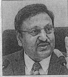
↑ தலைமை தேர்தல் ஆணையர் ராஜீவ் குமார்

மகாராஷ்டிராவில் 288 சட்டப் பேரவைத் தொகுதிகள் உள்ளன. இந்த தொகுதிகளுக்கு நவம்பர் 20-ம் தேதி ஒரே கட்டமாக தேர்தல் நடத்தப்படும். மாநிலத்தில் மொத்தம் 9.63 கோடி வாக்காளர்கள் உள்ளனர். அவர்களுக்காக 1,00,186 வாக்குச் சாவடிகள் அமைக்கப்படும். ஜார்க்கண்டில் 81 சட்டப்பேரவைத் தொகுதிகள்