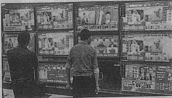
Early leads put out as early as 8.05am-8.10am is 'nonsense', said CEC

Suggesting that it was time for reflection and introspection by those conducting and disseminating exit poll outcomes, particularly the electronic media, the CEC said even though the EC does not govern exit polls under the ex-