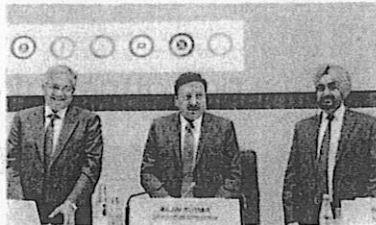
Poll mode: CEC Rajiv Kumar with Election Commissioners Gyanesh Kumar and Sukhbir Singh Sandhu at a press meet in Delhi.

Dates have also been announced for byelections to 48 Assembly seats and two parliamentary constituencies in 15 States. High-profile bypolls include the Wayanad parliamentary seat, which fell vacant after Congress leader Rahul Gandhi opted to retain Rae