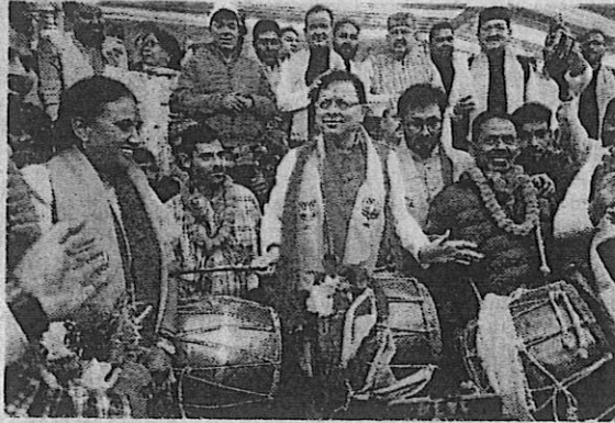
Uttarakhand chief minister Pushkar Singh Dhami at the Scheduled Caste conference organised ahead of the Kedarnath byelection in Rudraprayag on Tuesday.

Most of these seats fell vacant after the sitting MLAs contested the Lok Sabha elections and won while in some constituencies, the bypolls are being held due to death of the