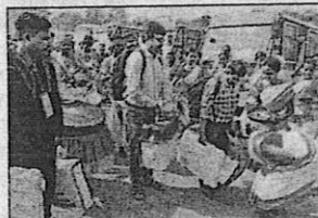
'SILENCE PERIOD': Tribals give a traditional welcome to a security official before he leaves for polling duty in Ranchi on Tuesday

Ranchi: Congress came under Election Commission's scrutiny in Jharkhand on Tuesday by waiting until the eve of the first phase of voting in 43 assembly constituencies to unveil its manifesto, constituting what could be a rare breach of the pre-poll 'sil-