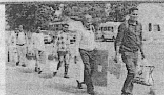
Democratic duty: Officials carrying election materials leave for duty in Jharkhand on Tuesday.