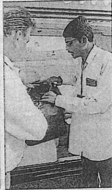
PRE-POLL SHENANIGANS: Screenshots from the video released by Shiv Sena (UBT) on Tuesday

tion Commission (EC) at Wani, Yavatmal, ahead of a poll rally on Saturday. He questioned if such checks were conducted on PM Modi, Union home minister Amit Shah, Maharashtra CM Eknath Shinde or his deputies, Devendra Fadnavis and Ajit Pawar.