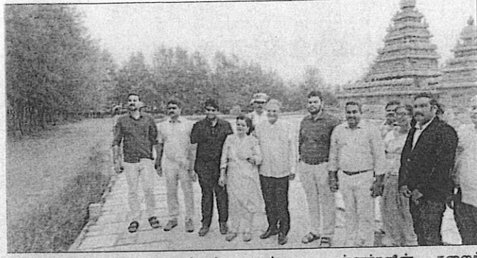
● மாமல்லபுரத்தில் அமைந்துள்ள பல்லை மன்னர்களின் கலைச் சின்னங்களை இந்திய தேர்தல் ஆணையர் கண்டு ரசித்தார்.