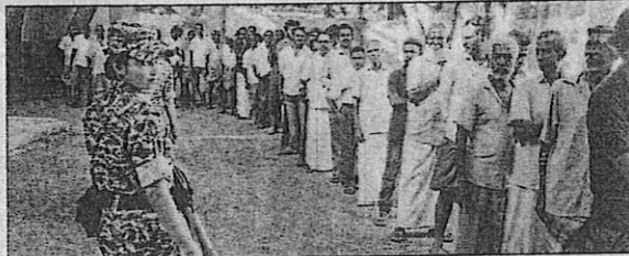
TO EXERCISE THEIR RIGHT: People queuing before a polling booth to cast their votes at Vikravandi in Villupuram

Villupuram: Polling in Vikravandi assembly constituency in Villupuram on Wednesday was brisk and peaceful. At the close of polling, 82.48% of people exercised their rights. A release from the district administration said 1.95 lakh people, including 95,536 men, 99,944 women and 15 others cast their votes. Counting and