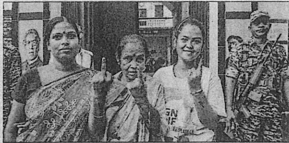
DUTY DONE: Voters show their ink-marked finger after casting vote in Kolkata's Maniktala on Wednesday

glaur constituency, four people were injured in a clash between supporters of rival parties at a polling booth.