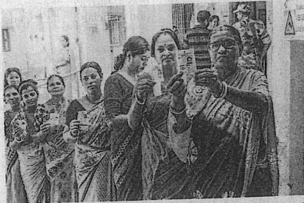
Making a choice: Voters showing their ID cards as they wait to cast their votes in the Ranaghat-Dakshin Assembly byelection.

The byelections are being keenly watched, especially in Himachal Pradesh, where polling took place in the three seats of Dehra,