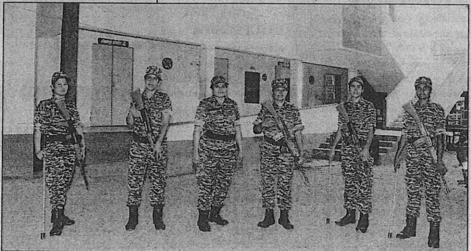
பதற்றமான வாக்குச்சாவடி என்று கண்டறியப்பட்ட விக்கிரவாண்டி ஊராட்சி ஒன்றிய நடுநிலைப்பள்ளியில் துணை ராணுவத்தினர் பாதுகாப்பு பணியில் ஈடுபட்டிருந்த காட்சி.

வாக்காளர் அனைவரும் வாக்குச்சாவடிகளுக்கு வந்து ஓட்டளிக்கும்படி வேண்டுகோள் விடுத்து இருக்கிறார்.