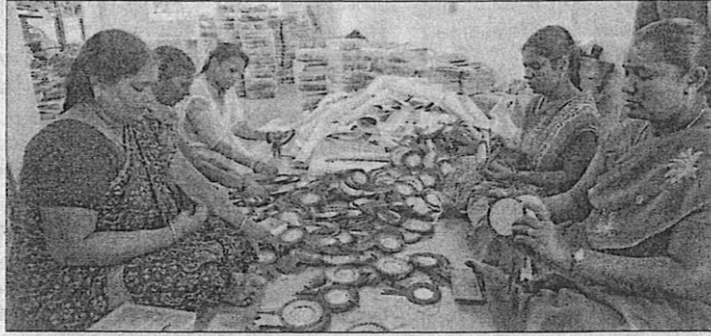
↑ விக்கிரவாண்டி தொகுதியில் நாளை வாக்குப்பதிவு நடைபெற உள்ள நிலையில், வாக்குச்சாவடிகளுக்கு தேவையான எழுதுபொருட்கள், அடையாள அட்டை உள்ளிட்டவற்றை தயார்படுத்தும் பணம் ஊழியர்கள்.