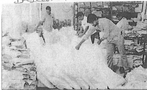
வாக்குச்சாவு, மையங்களுக்கு தேவையான டொருட்கள் விக்ரவாண்டி நாலுரை அலுவலகத்தில் இருந்து அனுப்பி வைப்பதற்காக நாயர் நிலையில் வைக்கப்பட்டுள்ள காட்சி.