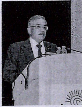
CEC Gyanesh Kumar addressing a conference of CEOs in New Delhi.

On Tuesday, the three-member commission led by Chief Election Commissioner (CEC) Gyanesh Kumar interacted with the CEOs on a series of topics. According to a senior offi-