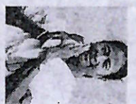
warned of an indefinite dharna before the poll body's office if corrective measures are not taken.

The West Bengal Chief Minister had on Thursday accused the BJP of enrolling fake voters from other states in the electoral rolls with the "help of the Election Commission" and