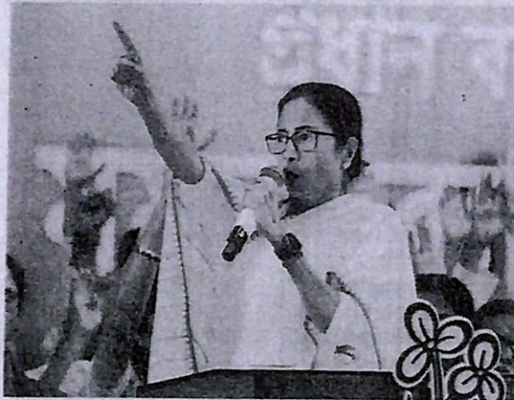
Levelling allegations: Mamata Banerjee had claimed that multiple voters, sometimes in different States, had same voter id number. ANI

"Election fraud of EPIC proportions! Smt. @MamataOfficial warned how