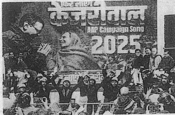
Sparks fly: The New Delhi constituency is seeing a tough battle between Arvind Kejriwal and his BJP and Congress rivals.

At a press conference on Saturday, AAP Rajya Sabha member Sanjay Singh alleged that several voter registration applications using the residential