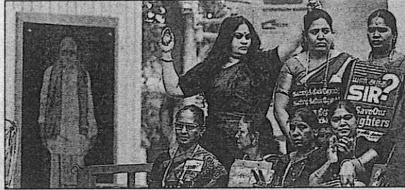
UP IN ARMS: AIADMK women wing stage a protest against women safety on Anna University campus at Saidapet in Chennai on Saturday

Palaniswami's announcement followed a meeting of district secretaries at the AIADMK headquarters. He cited concerns about the ruling DMK party's alleged misuse of power, violence, and voter intimidation as the reason for the boycott. "As they will not let the people cast their votes freely, and the by-poll will not be held freely, the AIADMK boycotts the by-poll," the former chief minister said. This decision comes less than six months after the party boycotted the Vikra-