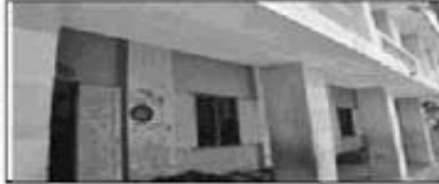
G.S.A. RAMP-II 2014-2015