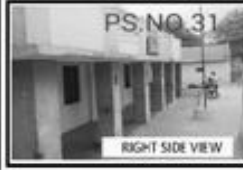
RIGHT SIDE VIEW