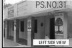
LEFT SIDE VIEW