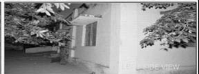
LEFT SIDE VIEW