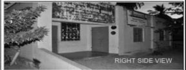
RIGHT SIDE VIEW