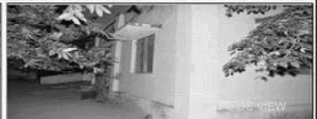
RIGHT SIDE VIEW