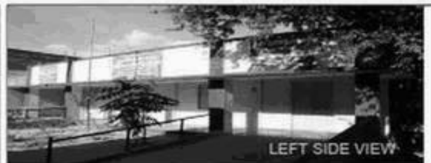
LEFT SIDE VIEW