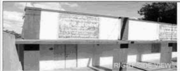
RIGHT SIDE VIEW