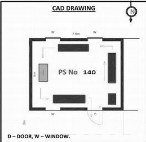
D - DOOR, W - WINDOW.