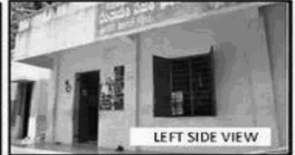
LEFT SIDE VIEW