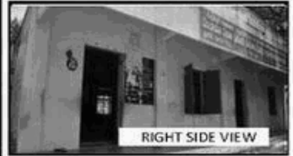
RIGHT SIDE VIEW