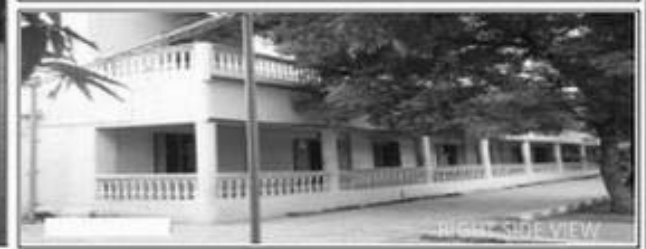
RIGHT SIDE VIEW