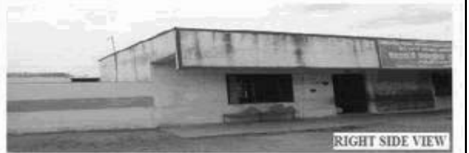
RIGHT SIDE VIEW