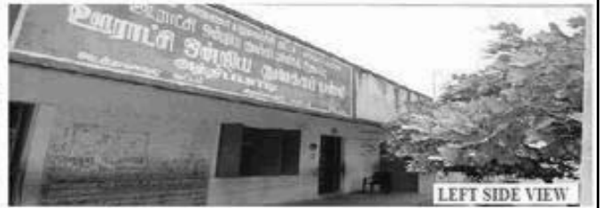
LEFT SIDE VIEW