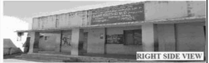
RIGHT SIDE VIEW