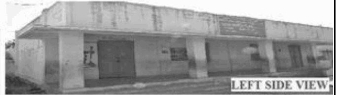
LEFT SIDE VIEW