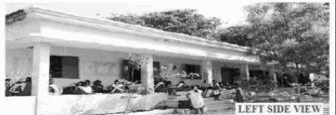
LEFT SIDE VIEW