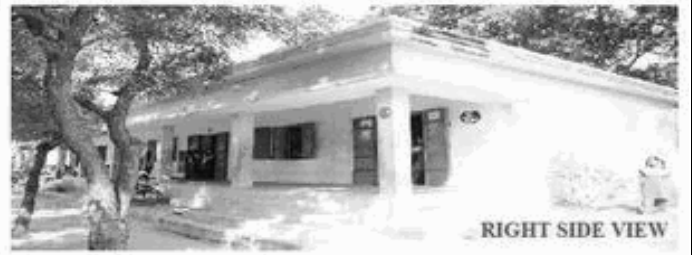
RIGHT SIDE VIEW