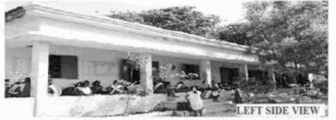
LEFT SIDE VIEW