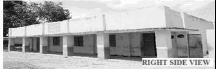
RIGHT SIDE VIEW