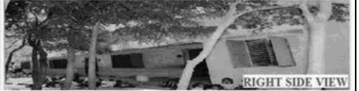
RIGHT SIDE VIEW