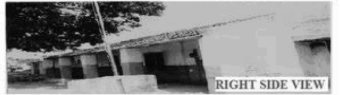
RIGHT SIDE VIEW