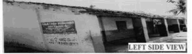
LEFT SIDE VIEW