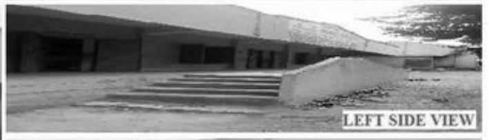
LEFT SIDE VIEW