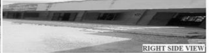
RIGHT SIDE VIEW