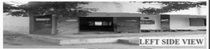
LEFT SIDE VIEW