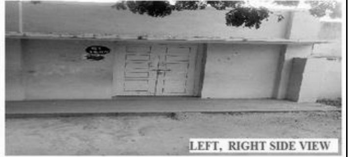
LEFT, RIGHT SIDE VIEW