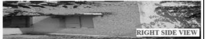
RIGHT SIDE VIEW