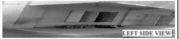
LEFT SIDE VIEW