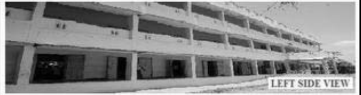
LEFT SIDE VIEW