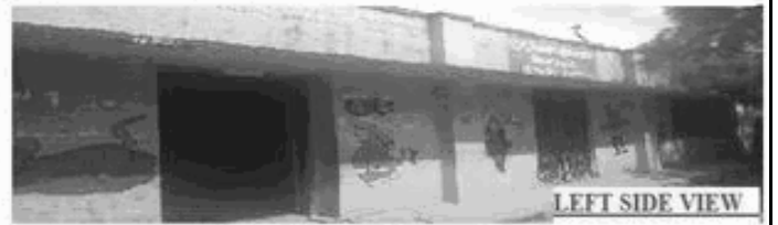
LEFT SIDE VIEW