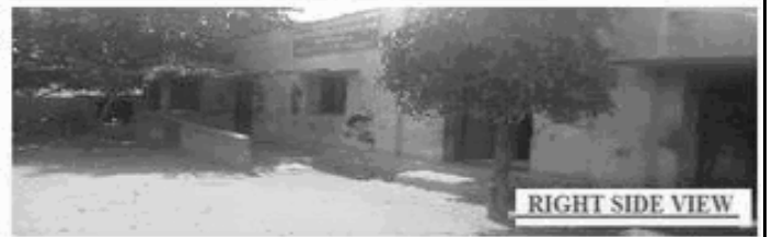
RIGHT SIDE VIEW