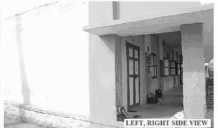
LEFT, RIGHT SIDE VIEW