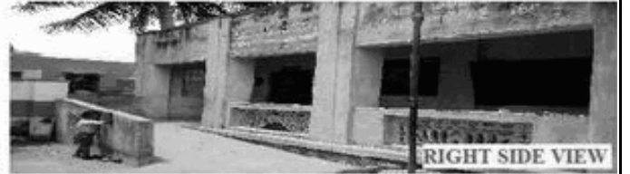
RIGHT SIDE VIEW