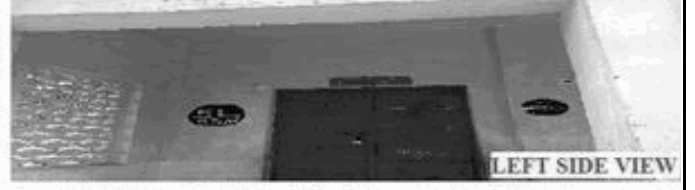
LEFT SIDE VIEW