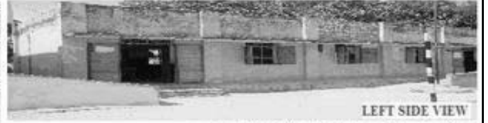
LEFT SIDE VIEW