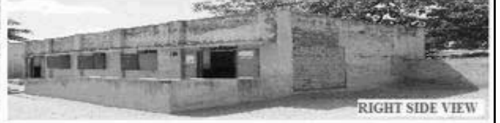
RIGHT SIDE VIEW